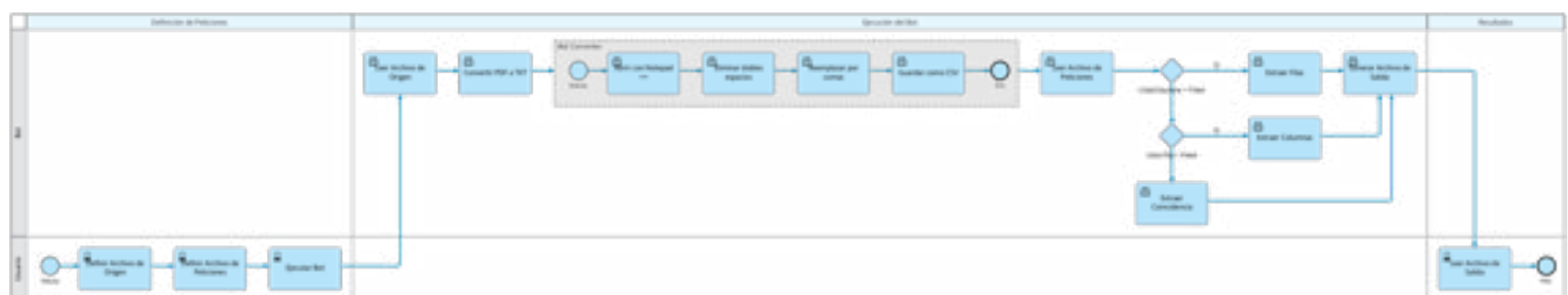
DIAGRAMA DE FLUJO